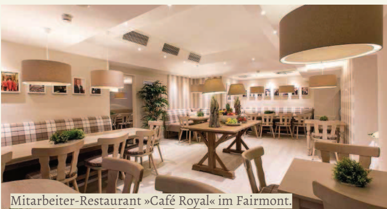
Mitarbeiter-Restaurant »Café Royal« im Fairmont.

erinnert mit ihren schwarz-weißen Fliesen an den unverwechselbaren Art-Deco-Stil des Jahreszeiten-Grills. Die Küche des Gourmetrestaurants Haerlin greift die warmen Erdtöne des Restaurants auf – grün, taupe, beige und braun dominieren. Gleiches gilt für den einzigartigen Chef's Table im Herzen der Haerlin-Küche, in dem Gäste dem Sternkoch und seiner Brigade über die Schulter schauen und zeitgleich seine Kreation genießen können. Den letzten Clou landete Ingo C. Peters mit der Renovierung der Fleischerei des Hotels und der Patisserie: Die Fleischerei erinnert an eine urige und gemütliche Jagdhütte und gleicht so gar nicht einer Küche, während die Patisserie an malerische Impressionen des Versailler Schlosses erinnert. Nicht nur, dass die Mitarbeiter einen unverwechselbaren Arbeitsplatz genießen und somit allerhöchste Wertschätzung erfahren, auch öffnete der Direktor all diese Bereiche der Öffentlichkeit und schuf eine einzigartige Event-Location auf mehr als 600qm: tagsüber Küche, abends Event-Location.